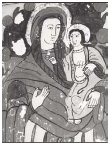
Pictură pe sticlă, Nicula, sec.XVII

la răspunsul îngerului, că „Duhul Sfânt se va pogori peste tine și puterea Celui Preaînalt te va umbri; pentru aceea și Sfântul care se va naște din tine, Fiul lui Dumnezeu se va chema” ( Luca 1, 35 ), Fecioara Maria acceptă, smerită și ascultătoare, să devină Maica Fiului dumnezeiesc, și-i zice: „Iată roaba Domnului. Fie mie după cuvântul tău!” ( Luca 1, 38 ). Atunci, îngerul îi aduce la cunoștință că, și „Elisabeta, rudenia ta, a zămislit fiu la bătrânețe ei, și aceasta este a șasea lună pentru ea, cea numită stearpă” ( Luca 1, 36 ), apoi a plecat.