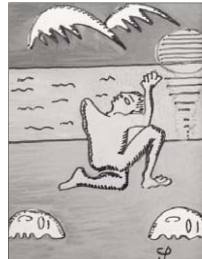
(Două picturi pe lemn de peichirdan)

Piere totu` ce se naște Unde locu` vântu-l paște. Iar deșertul ca o apă Toate gândurile-ngroapă.”