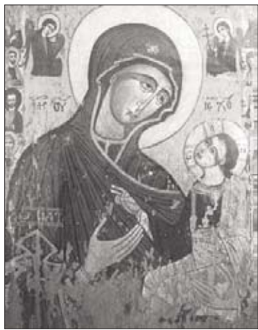
Pictură pe lemn, Dintr-un Lemn, sec.XVI

sine: ce fel de închinăciune poate să fie aceasta?” ( Luca 1, 29 ). Văzându-i tulburarea, „îngerul i-a zis: Nu te teme Marie, căci ai aflat har la Dumnezeu și, iată, vei lua în pântec și vei naște fiu și vei chema numele lui, Iisus. Acesta va fi mare, și Fiul Celui Preaînalt se va chema” ( Luca 1, 30-32 ). Noi, înțelegem și mai bine tulburarea sufletească a Fecioarei, din explicația pe care o cere îngerului, zicându-i: „Cum va fi aceasta, de vreme ce eu nu știu de bărbat?” ( Luca 1, 34 ). Însă,