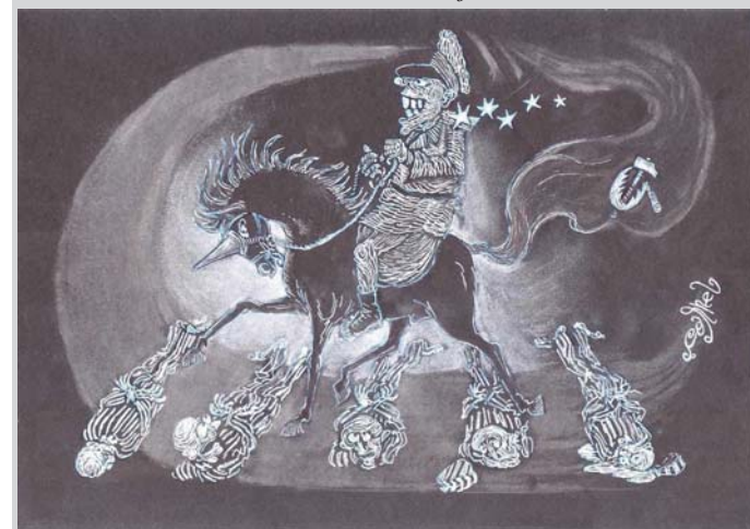
CHIOREAN, Dresaj uman

Din păcate, Cetatea dacică de la Grădiștea, nu a convins și nu a reușit să atragă interesul specialiștilor, dovadă slaba preocupare a acestora în a face o cercetare profundă a sitului. Dar am convingerea că aici se ascund multe informații Depinde doar de specialiști de a le scoate la lumină și de a le face cunoscute. Altfel timpul și mai ales oamenii vor distruge iremediabil și ultimele urme ale unui trecut glorios dacic pe aceste meleaguri.