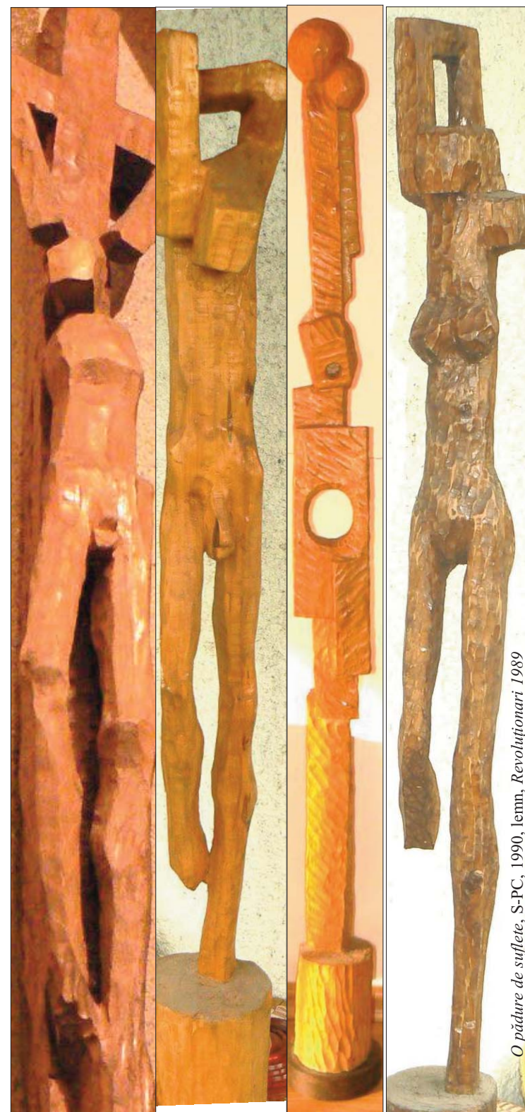
O pădure de suflete, S-PC, 1990, lemn, Revoluționari 1989