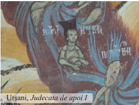
Urșani, Judecata de apoi I

(...) Uitați aici anul 1905 anul de terminare, la 1800 s-a început. Ca la orice biserică deasupra avem pisania cu litere chirilice și în dreapta noastră sau în stânga cum ai sta cu spatele la biserică este imaginea iadului făcută de meșteri populari