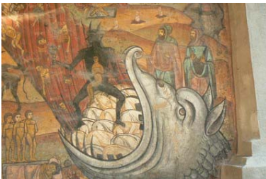
Râmnicu Vâlcea, Judecata de apoi , biserica M. Domnului

care prin imaginea această a iadului trebuiau să transmită omului simplu să se ferească de păcatele care-i pășteau zi de zi și reprezentate în aceste picturi. Se poate numi această pictură biblia neștiutorilor de carte și aici își găsesc