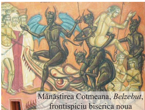
Mănăstirea Cotmeana, Belzebut , frontispiciu biserica noua