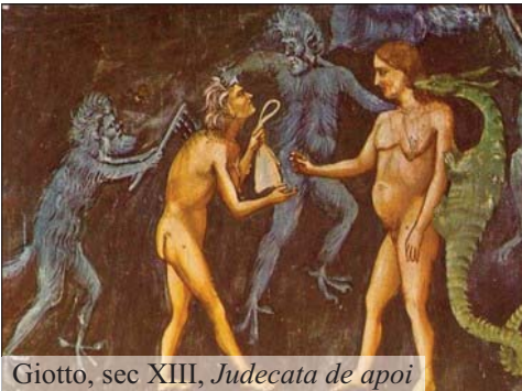
Giotto, sec XIII, Judecata de apoi

credinșoșilor de a nu ajunge în iad, aici este gura de foc sau balaurul cu gura de foc ce înghite pe toți ce au fost judecați în balanță de către îngeri.