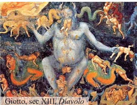
Giotto, sec XIII, Diavolo