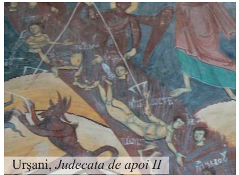
Urșani, Judecata de apoi II

(...) Uitați aici anul 1905 anul de terminare, la 1800 s-a început. Ca la orice biserică deasupra avem pisania cu litere chirilice și în dreapta noastră sau în stânga cum ai sta cu spatele la biserică este imaginea iadului făcută de meșteri populari