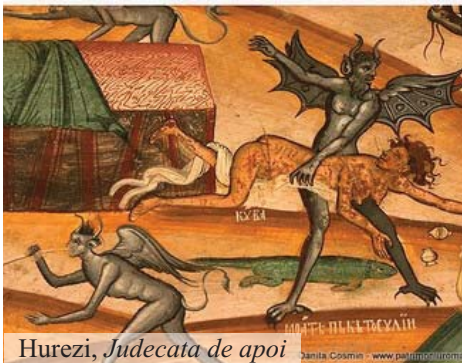
Hurezi, Judecata de apoi