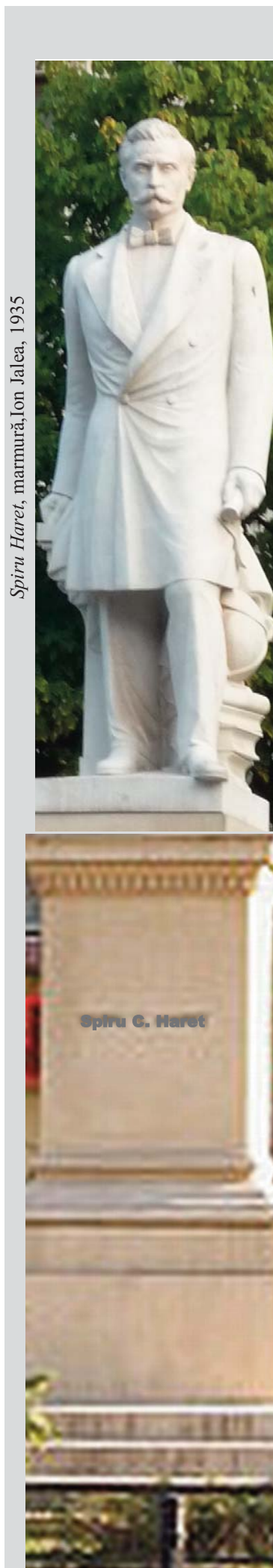
Spiru Haret, marmură, Ion Jalea, 1935