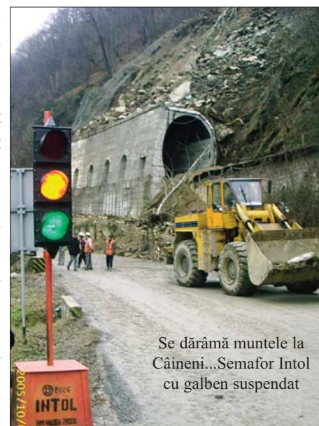
Se dărâmă muntele la Căineni...Semafor Intol cu galben suspendat

Aceeași situație, în 2005 (să nu credeți că în 2005 conducea Traian Băsescu!...conducea primul ministru în funcție, împreună cu fostul prim ministru, în spate), când se dărâmă muntele la Căineni, după Anul Nou și aleargă toți îngroziți după mine să le semaforizez, mobil, drumul pe o singură bandă, în toiul iernii; eu de zece ani, atunci, semaforizând fără galben, cu un extraordinar succes, cum nu se mai văzuse niciodată, neavând accidente și nici o coliziune de mașini, semafoarele mele cu leduri (iluminat rece) încă din 1994, mergând aproape continuu, nesupravegheate, ziua și noaptea. Urma să vină, de aia era graba mare, președintele sta-tului, și trebuia organizare fără cusur, ministrul transporturilor și directorii AND, dormind acolo, sub căderea de bolovani, la Căineni! A fost o lucrare extraordinară, apreciată de prefect și președenție, dar care s-a lăsat cu demisia ministrului și sancționarea AND Craiova pentru că încercaseră, ulterior, să mă tragă pe sfoară, și să nu-mi plătească lucrarea, normal, destul de scumpă!Fie-mi scuzate divagațiile, dar ele sunt în tonul cărții, una pe care deși nu mai este nevoie, o recomand oricărui cititor, dar mai ales acelora care au băgat de seamă, că asemenea oameni, precum perso-najul cărții, protejații lor, se află la originea acestei năruiri a României, fără șansă de a mai fi redresată vreodată! Să nu mai vorbim de creștere economică, de dezvoltare, când săracii fac copii ca să aibă ceva, și ei, nu se știe cât timp, de mâncare!